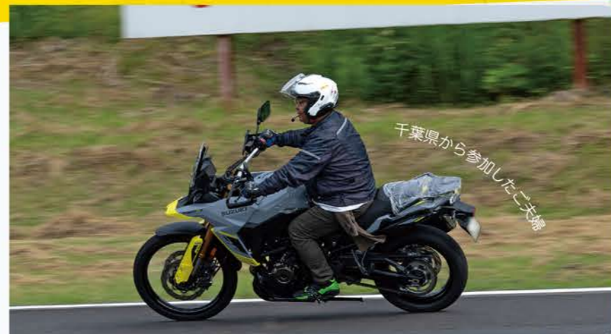
千葉県から参加したご夫婦