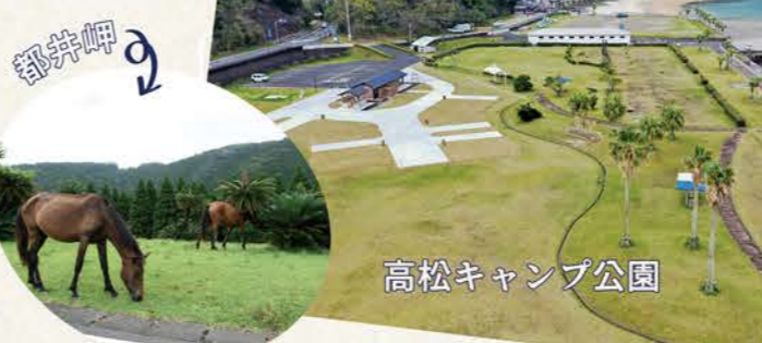
高松キャンプ公園