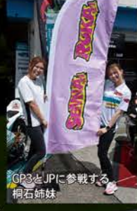
GP3とJP1に参戦する桐石姉妹