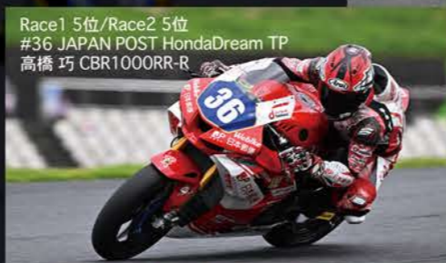
Race1 5位/Race2 5位 #36 JAPAN POST HondaDream TP 高橋 巧 CBR1000RR-R