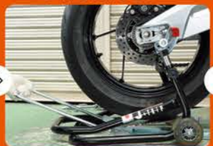
④お助けリフターAの取っ手を後ろに引きながら、リアタイヤを上下させてアクスルシャフトを通る様に穴位置をセット。あとはアクスルシャフトを差し込むだけ。