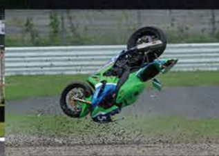
Race1 1位/Race2 3位 #32 SDG Motor Sports RT HARC-PRO 榎戸 育寛 CBR1000RR-R