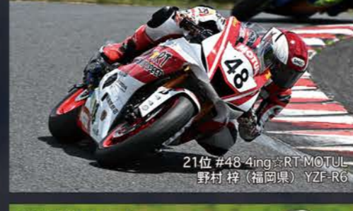
21位 #48 4ing RT MOTUL 野村梓 (福岡県) YZF-R6