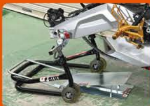
①お助けリフターAを写真の位置にセットする。