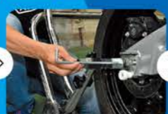
③シャフトで貫通させます。最後までしっかりと貫通させます。