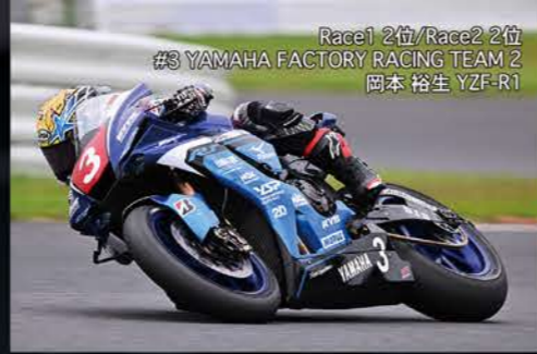
Race1 2位/Race2 2位 #3 YAMAHA FACTORY RACING TEAM 2 岡本 裕生 YZF-R1