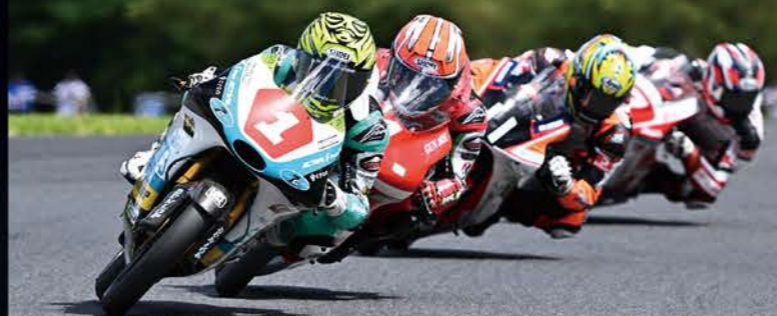
1位 #1 P.MU 7C GALESPEED 尾野 弘樹 NSF250R