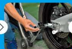
②高さは2段目に調整し、幅を適度に調整する。