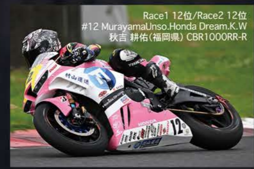
Race1 12位/Race2 12位 #12 MurayamaUnso.Honda Dream.K.W 秋吉 耕佑(福岡県) CBR1000RR-R