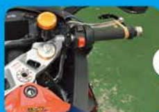
①ブレーキレバーを、何かでロックする。ステアリングは必ず左いっぱい切る。