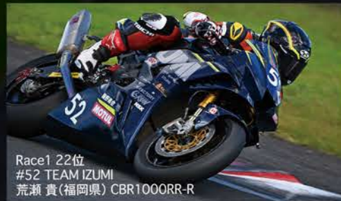
Race1 22位 #52 TEAM IZUMI 荒瀬 貴(福岡県) CBR1000RR-R