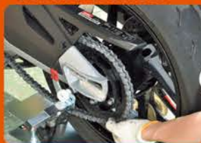
③スプロケットにドライブチェーンを掛ける。