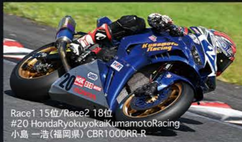
Race1 15位/Race2 18位 #20 HondaRyokuyokaiKumamotoRacing 小島 一浩(福岡県) CBR1000RR-R