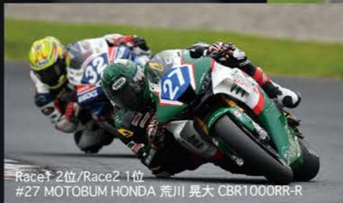
Race1 2位/Race2 1位 #27 MOTOBUM HONDA 荒川 晃大 CBR1000RR-R