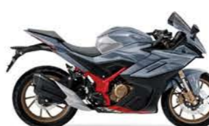
Demon GR200R Dacorsa2