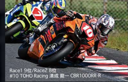
Race1 9位/Race2 8位 #10 TOHO Racing 清成 龍一 CBR1000RR-R