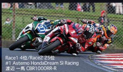
Race1 4位/Race2 25位 #1 Astemo HondaDream SI Racing 渡辺 一馬 CBR1000RR-R