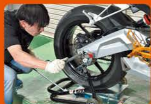
④お助けリフターAの取っ手を後ろに引きながら、リアタイヤを上下させてアクスルシャフトを通る様に穴位置をセット。あとはアクスルシャフトを差し込むだけ。