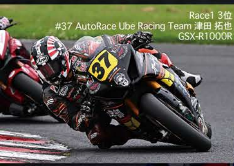
Race1 3位 #37 AutoRace Ube Racing Team 津田 拓也 GSX-R1000R