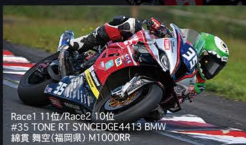
Race1 11位/Race2 10位 #35 TONE RT SYNCEDGE4413 BMW 綿貫 舞空(福岡県) M1000RR