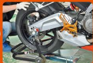
②お助けリフターAに乗せるようにタイヤをセットする。