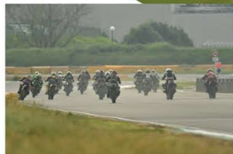
Photo & Text : withBIKE HSR九州において鉄フレーム4気筒以上のマシンで 争う祭典『鉄馬 with ベータチタニウム』が開催され た。昨年は台風の影響で泣く泣く中止となったが今年 は真夏の様な快晴に恵まれた。 今大会にも全国からエントリー、有名バイクメーカー が多数訪れ、『鉄馬フードコーナー』には18店舗もの飲食 店が軒を連ねた。フリーイング時には地元の日吉神社 の宮司によるお祓いもありレースの無事を祈願した。 今大会も高品質なチタン製ポルトなどを製造販売するフ ランドTITANIUM(ベータチタニウム)が冠ス ポンサーを務めており、優勝ライダーへの盾は特製のチ タンプレートとなっている。 また、全日本ロードレース選手権表彰式でもおなじみの 『KENTEX』が各クラス優勝者に腕時計の授与も行う という豪華っぷり!

開催クラスはアイアンモンスター18(A・B)、アイアン スポーツエキスパート、アイアンモンスター1750、 アイアンモンスター400、アイアンモンスター 17、アイアンスポーツ、アイアンNK4、そして Z900RS。 1日のスケジュールは午前中に各クラスの 予選とセミファイナルレース。午後にはファ イナルレースという流れ。貴重な旧車、 カスタムレーサーを全開で走らせるの で観客の数も多い。 予選レース中に転倒者はいたが大 事には至っていない事は何より だった。