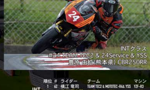
INTクラス #24 TEAM TEC2 & 24Service & YSS 豊原由弘 (熊本県) CBR250RR