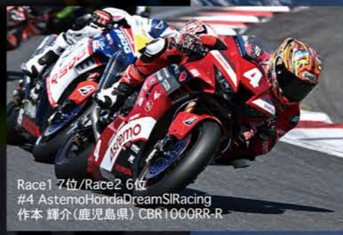
Race1 7位/Race2 6位 #4 Astemo Honda Dream SI Racing 作本 輝介(鹿児島県) CBR1000RR-R