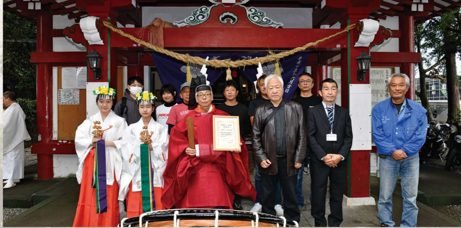
第十八号 熊野オートバイ神社 〒889-2151 宮崎県宮崎市熊野 6976