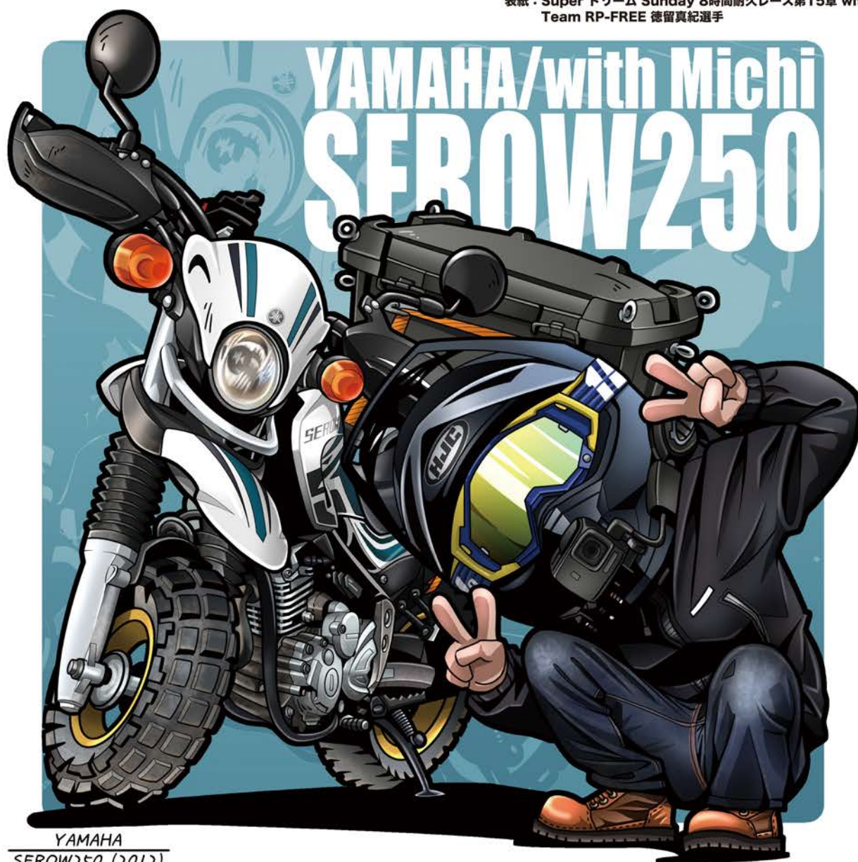
YAMAHA SEROW250 (2012)