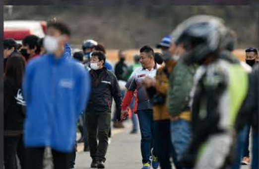
以前連載コラムを寄稿してくれていた 国際ライダーの中谷真季選手