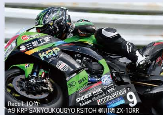
Race1 10位 #9 KRP SANYOUKOUGYO RSITOH 柳川明 ZX-10RR