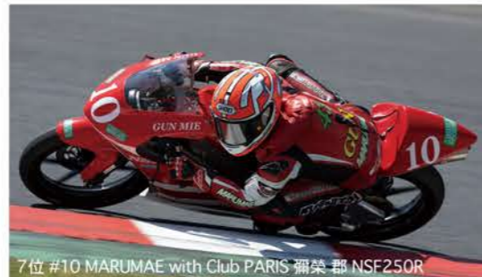
7位 #10 MARUMAE with Club PARIS 彌榮 郡 NSF250R