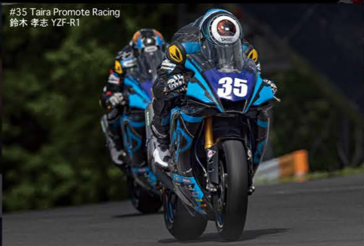
#35 Taira Promote Racing 鈴木 孝志 YZF-R1