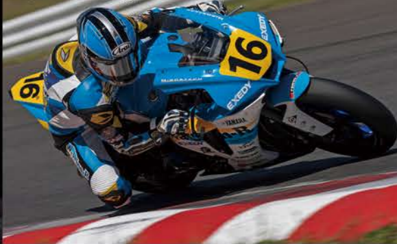
Race1 14位/Race2 15位 #16 WaveinnR 中富 伸一 YZF-R1