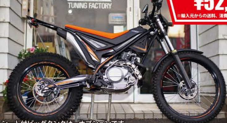
シート付ビッグタンクは、オプションです。