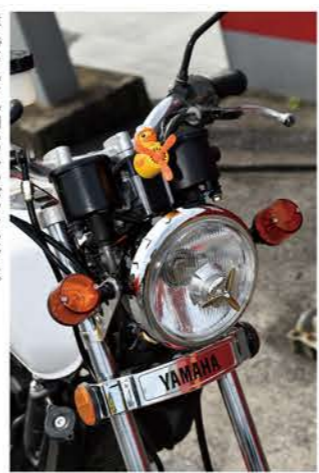
走ればクルクル回るファンがアクセント。