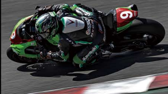
Race1 11位/Race2 12位 #9 KRP SANYOUKOUGYO RSITOH 柳川 明 ZX-10RR