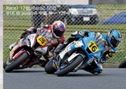
Race1 17位/Race2 18位 #16 W aveinnR 中富 伸一 YZF-R1