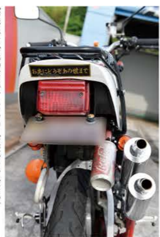
「お先にその世ま」ステッカーがお気に入りだとか。フューバイクは世間モノ!