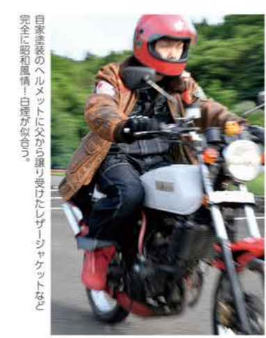
自家塗装のヘルメットに父から譲り受けたレザージャケットを、完全に昭和風情！白煙が似合っ