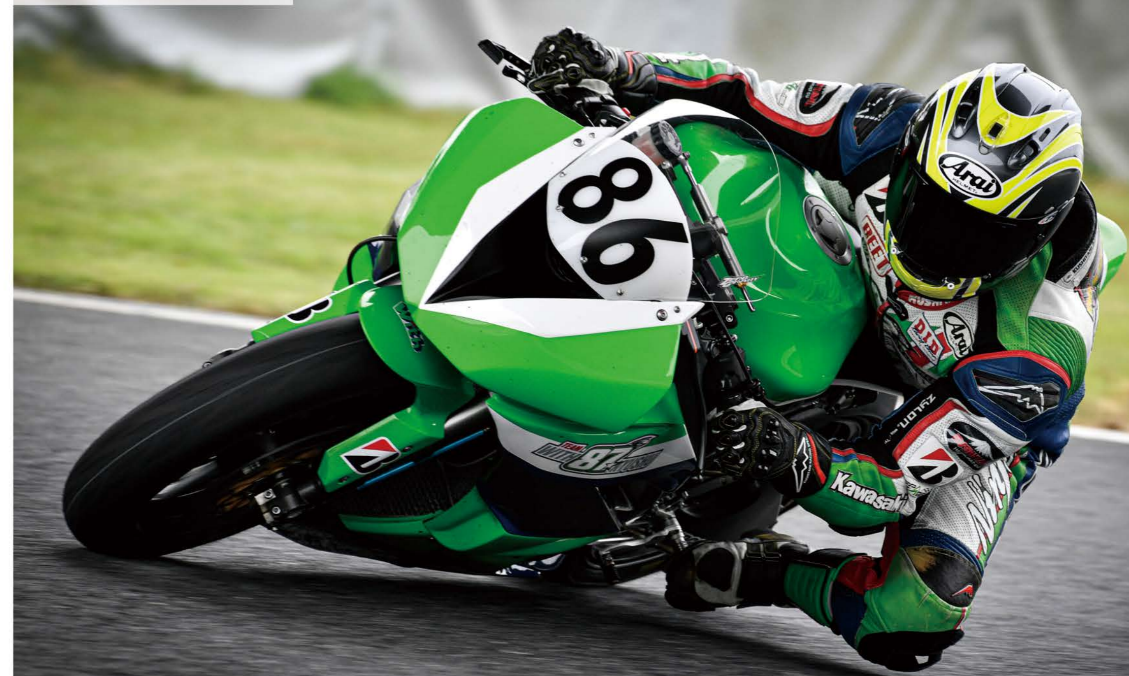
Text: withBIKE 取材協力: 南九州自動車学校

2020年シーズンで全日本ロードレース選手権から 現役引退をした福岡県出身の西嶋氏。 若き日、情熱だけでレースの世界に飛び込み、 そして伝説のプライベートチームのエースまで駆け上がり、 鈴鹿8耐ではワークスチーム以上の成績も収めた。 数々の戦いを振り返りつつ、これからの事も含めてじっくりと話を伺った。