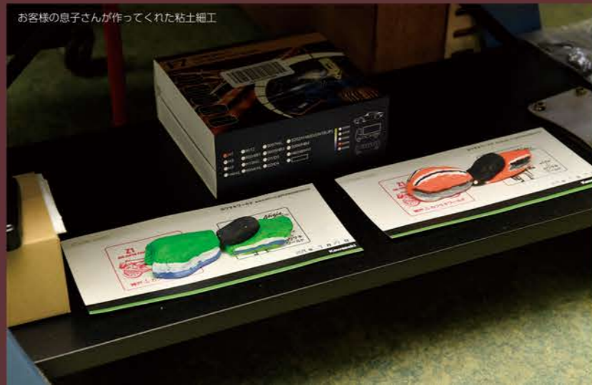
お客様の息子さんが作ってくれた粘土細工