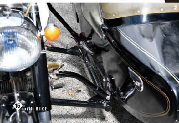
1:メーターはスピードのみとシンプル。ウィンカーは太鼓型だ 2:サイドカー横にサイドブレーキを装備。ハンドリングはクセが強いとのこと