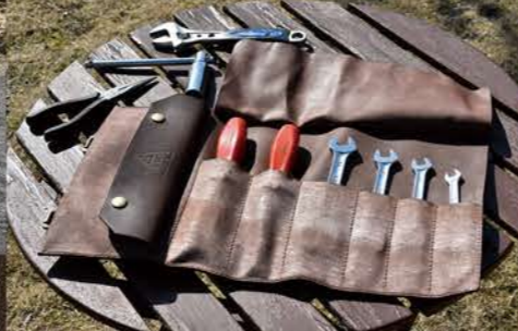
これだけの工具が収納可能。 あまり詰め込むと丸めた時に太くなりすぎる。