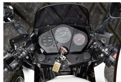
メーターはセンターがスピードで右がタコ。左の丸の中でターンやニュートラル、ハイビーム、警告灯などが光る。クラッチは油圧式だ

KATANAといえば、多くの人はターゲットデザイン社がデザインした形を思い浮かべるだろう。しかし、この1984年に発売された国内III型と呼ばれるKATANAはスズキ社内でのデザインであり「リトラクタブルヘッドライト」を採用している。当時は四輪スポーツカーの多くがこのリトラクタブルヘッドライトであったが、二輪で採用されたのは一部のスクーターを除き他に例はない。