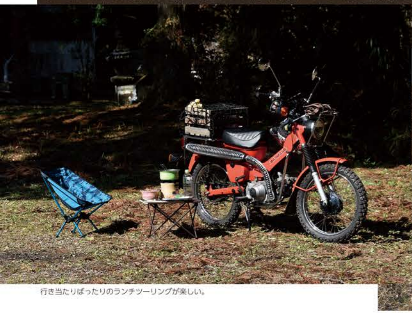
行き当たりばったりのランチツーリングが楽しい。