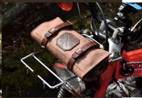
LUTHERIE LEATHERS と withBIKE の頭文字を サイドバッグのジェリカン風クロスで刻印！

先月の特注レザーサイドバッグに引き続き、今月は特注ツールバッグ！ コンセプトはもちろんサイドバッグの路線と同様に「他には無い大人の旅仕様」だ。