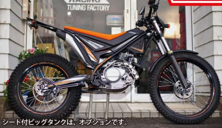
シート付ビッグタンクは、オプションです。

田畑、山などの見回り、獣道ツーリングなど、通常のオフ車では入りこめない奥地まで軽さと足つき性の良さを生かして活躍。豊富なKORレーシングオリジナルのオプションパーツが競技でも使えるほどのポテンシャルを發揮!