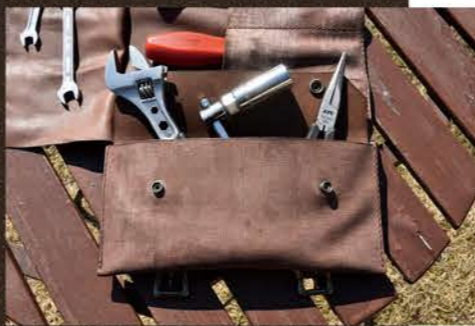
サイドポケットはボタンで止められるので 小さな物も落とすことはない。