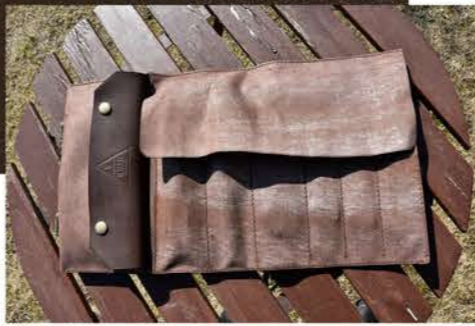
ペロを被せてから丸める。 しかし一見レザーには見えない。