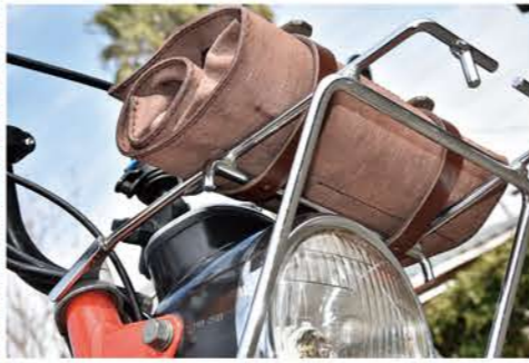
フロントキャリアと共に止めることで 左右へのガタつきも無い。

一見キャンパス生地に見えるが全てレザー。もちろん総 手縫い！長きに渡るルシアーレザーの歴史の中で、意外や 意外、初めての形だそう。 今回もCT110に合うサイズ感としてもらったが、見事 にジャストフィット。そしてフロントの純正キャリアにペ ルトで止めてしまうので、実に自然に収まっている。 スハナやドライバーを入れるポケットはペロを被せて丸 める事で落ちる事は無い。これだけ携帯していればほとん どの応急処置は出来る事だろう。 また、刻印もLUTHERIE LEATHERS と withBIKE のスヘシャルでワンオフならでは。 ここまでしっかり作りで15,000円ほどでオー ダー出来るというから、気になる方はウイズバイクにメー ルしてみたい。喜んでご紹介致します。 info@withbike.jp ウイズバイクレザー係