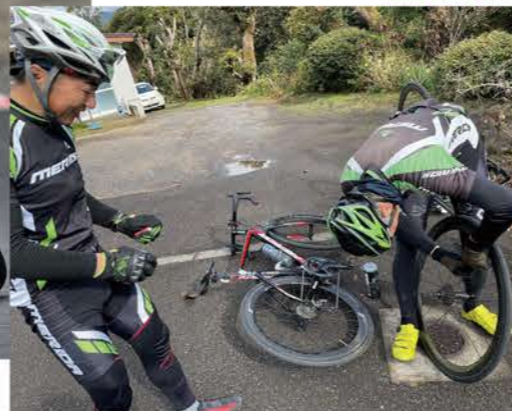
道中は2回のパンク