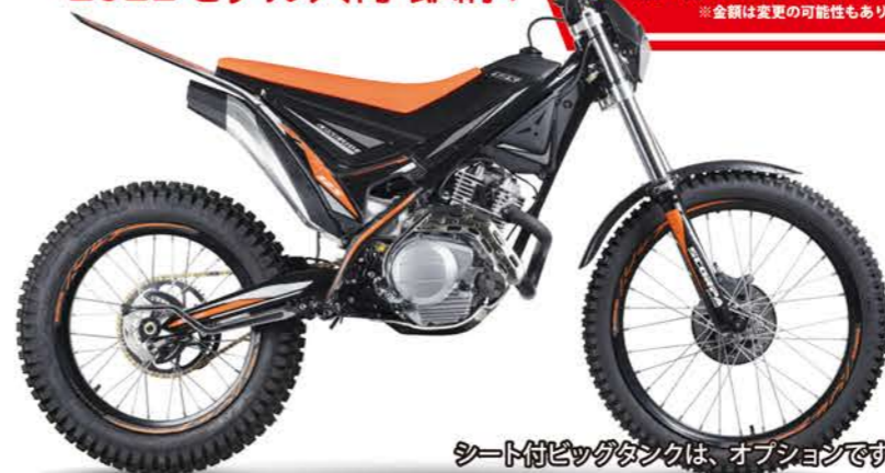
シート付ビッグタンクは、オプションです。

田畑、山などの見回り、獣道ツーリングなど、通常のオフ車では入りこめない奥地まで軽さと足つき性の良さを生かして活躍。豊富なKOLEーシングオリジナルのオプションパーツが競技でも使えるほどのポテンシャルを発揮!