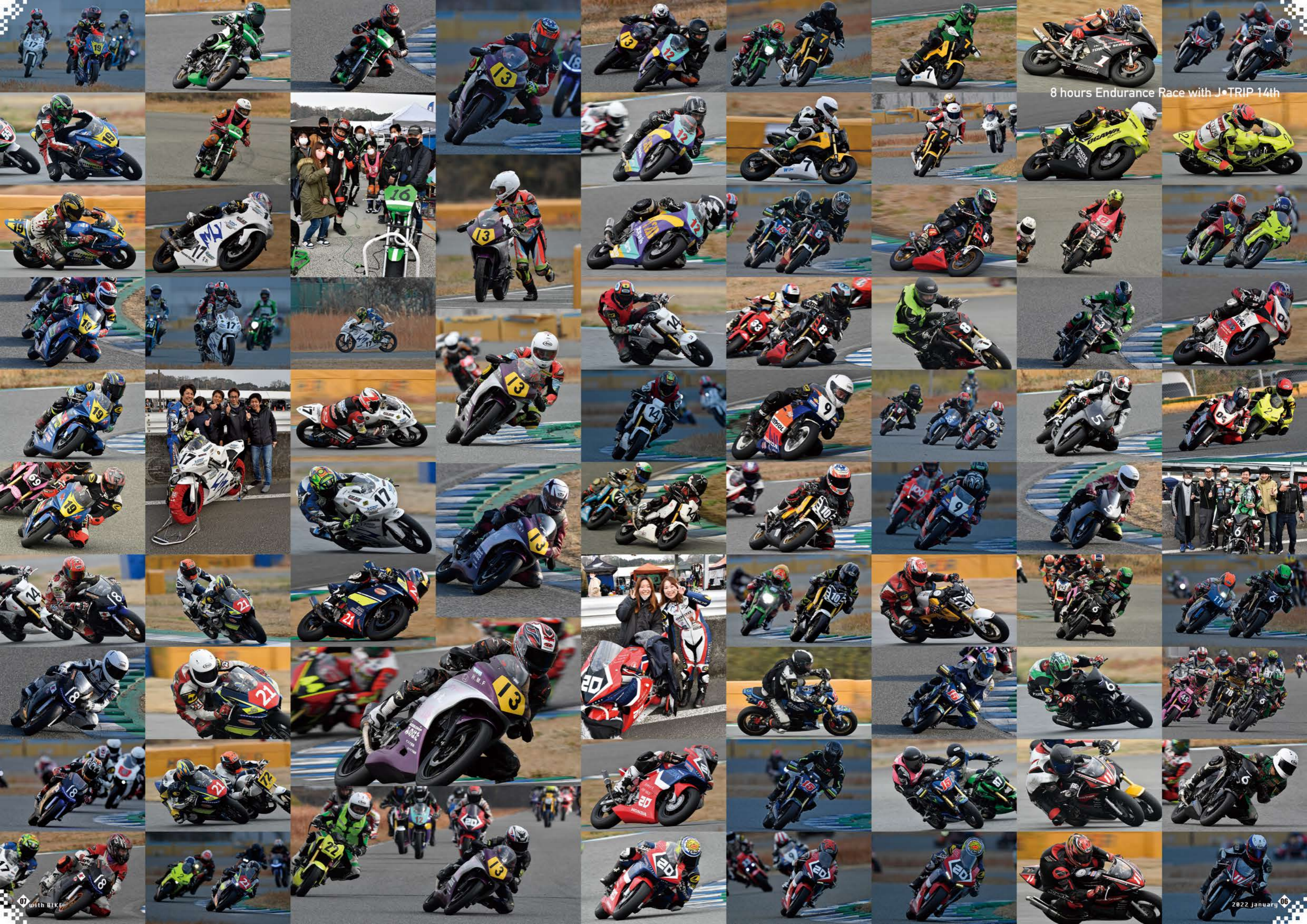
8 hours Endurance Race with J•TRIP 14th