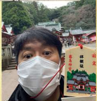
ウイズバイクカレッジに住む住人たち(左部抜粋)今年で58歳、51歳、41歳、36歳というヤングばかり(笑)

改めましてあけましておめでとうございます！ まずは年の瀬に鹿児島県の霧島神宮へ特別拝観に行ってきました。霧島神宮社殿が国宝指定になったので記念して日時限定・人数限定で特別公開した訳です。日頃見れないと言われれば行ってみたいくなるのが人情ですね(笑)良いものを見せていただきましたが、内部は撮影禁止でしたので霧島神宮公式ページをご覧ください。 さて季節は真冬ですが、50歳にして初めてハンドルカパーというものを買ってみました。早速CT110に装着して走ってみましたが、寒くはないですが、ヘルメットシールドの開閉やちょっとした時に手の出し入れがしにくく、早速使用を断念してしまいました(笑)