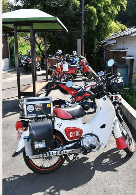
11月よりこの場所でバイクミーティングを開催予定