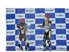
HighwayStar PRO600 順位 # ライダー チーム マシン 1 8 沼田 雅史 Team AGGRESSIVE CBR600RR 2 79 山口 和希 RSGLレーシング CBR600RR