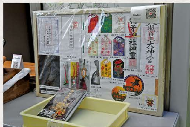
二輪用御守りステッカーなどはPayPay払いも可