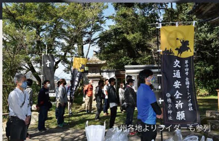
九州各地よりライダーも参列