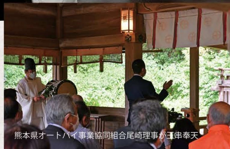
熊本県オートバイ事業協同組合尾崎理事が玉串奉天