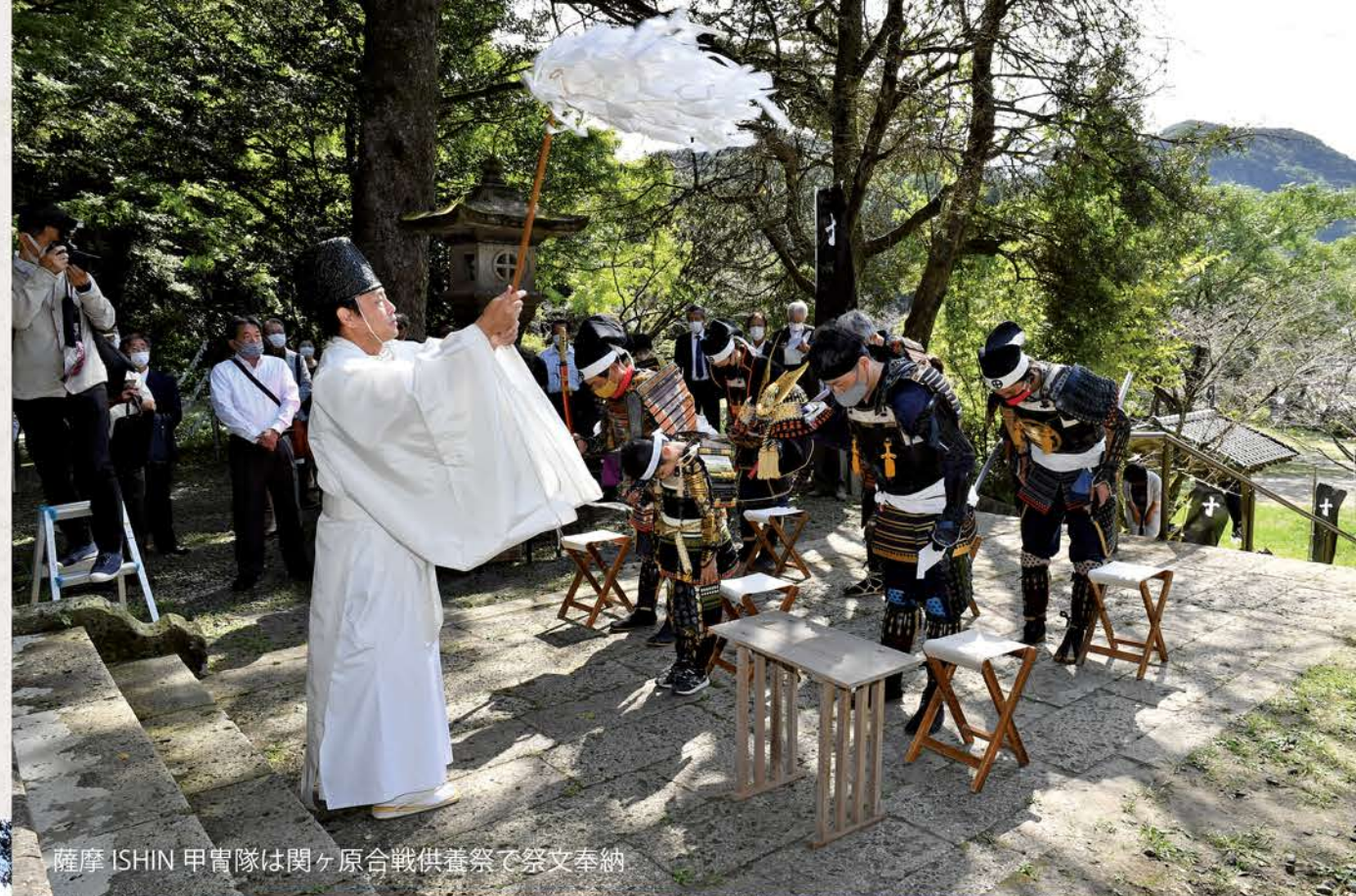
薩摩 ISHIN 甲冑隊は関ヶ原合戦供養祭で祭文奉納