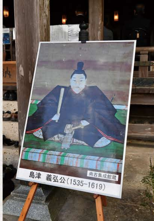
島津 義弘公(1535-1619)