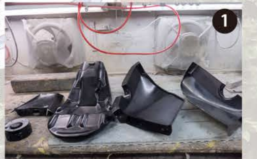
1 スタートタンクを元にRピースの型を作成。