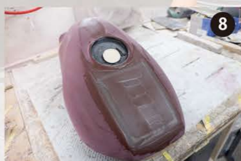
8 切開した部分を閉じて成型する。