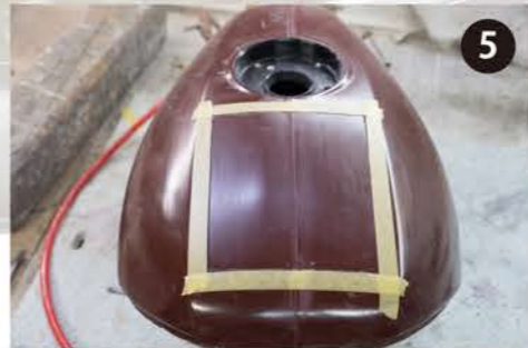
5 アップピースとロアピースを接続し、上面を切開する。