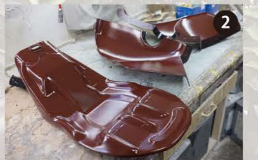
2 型を組み合せ貼り込む準備。