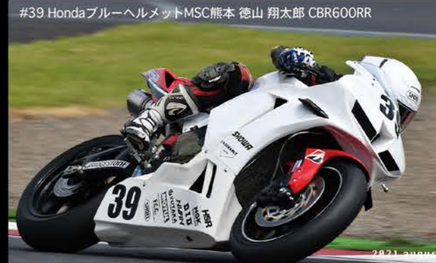
#39 HondaブルーヘルメットMSC熊本 徳山 翔太郎 CBR600RR