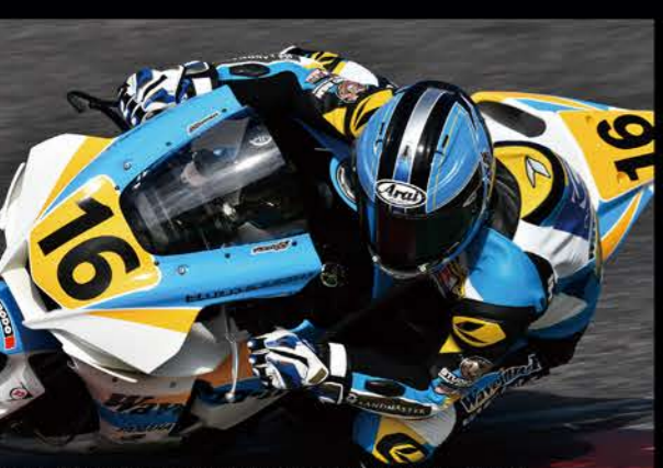
Race1 14位/Race2 15位 #16 Waveinn-R 中富 伸一 YZF-R1