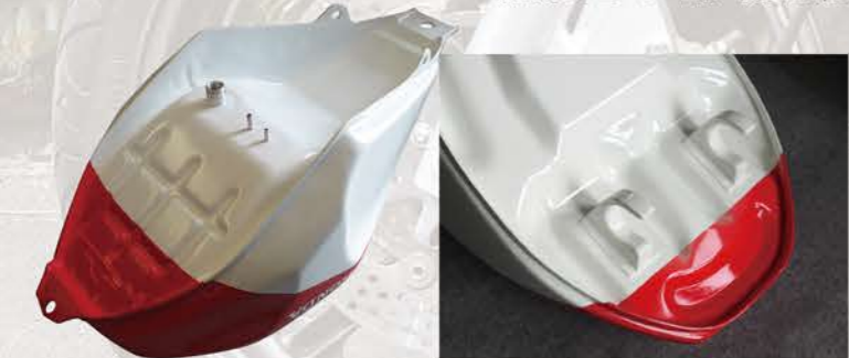
TZR250用では、前部固定用フックも再現。もちろん強度も確保している。

参考価格 (FZ750用) 初期型1FMカラー仕様 税込195,800円 無塗装サフェーサー仕様 税込156,200円