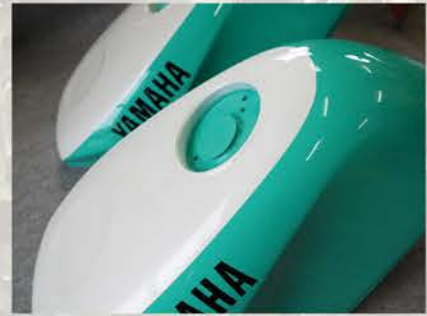
細部までスタンダードと同様