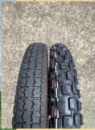
▲左がIRCのスタンダードタイプ、右がGP-22だ。サイズはスタンダードが2.75でGP-22は80/90-17。表記は違うがサイズ的にはほぼ問題ない。