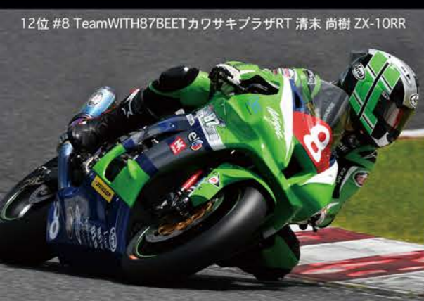
12位 #8 TeamWITH87BEET カワサキプラザRT 清末 尚樹 ZX-10RR