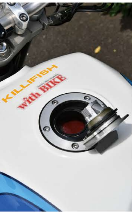
フューエルキャップはオリジナルになる。走行車での活用。キャップを開ければ、FZ750用のものが使えます。