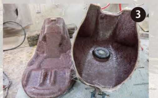
3 型FRPを貼り込んでいく。