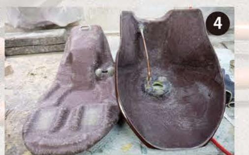
4 アップピースに水抜きパイプを装着。ロアピースに繊維マットの取り出し口を製作。