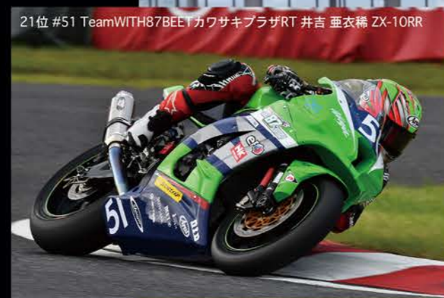
21位 #51 TeamWITH87BEET カワサキプラザRT 井吉 亜衣稀 ZX-10RR