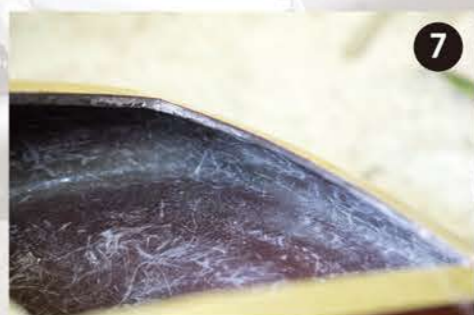
7 アップピースとロアピースの接合面にガラスマット繊維を貼り、ポリエステル樹脂で強化する。これがシームシール工法。