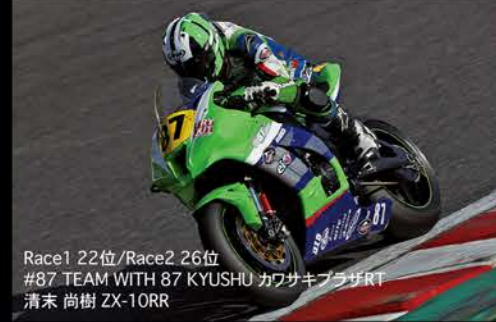
Race1 22位/Race2 26位 #87 TEAM WITH 87 KYUSHU カワサキブラザRT 清末 尚樹 ZX-10RR