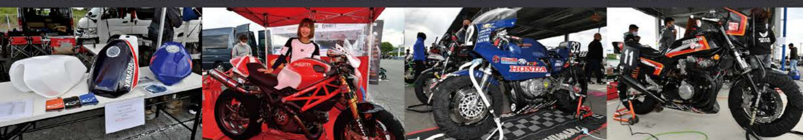
テーククラフトはオリジナルFRPタンクを展示 ラ・ベレッツァからエントリーするのは小柄なママさん！ 鉄馬ではお馴染みのCB400FOURにはウイズバイクステッカー！ 上品なまとまりを見せるホンダCB1100F