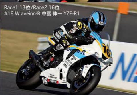
Race1 13位/Race2 16位 #16 W aveinn-R 中富 伸一 YZF-R1