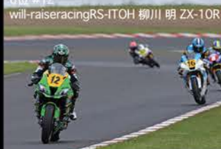
6位 #12 will-raceracingRS-TOH 柳川 明 ZX-10R