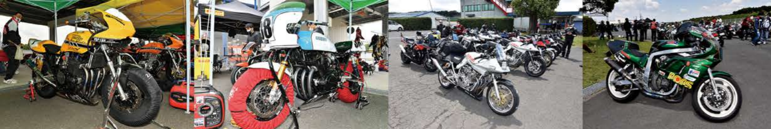
ヤマハXR1200・1300レーサーといえばYSP久留米 少数派ではあるがスズキGS系もカッコイイ 会場ではスズキ刀ミーティングも開催 日本人離れしたデザインがシブいGSX-R