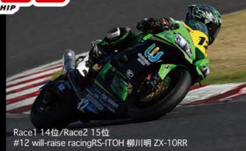
Race1 14位/Race2 15位 #12 will-raise racing RS-ITOH 柳川明 ZX-10RR