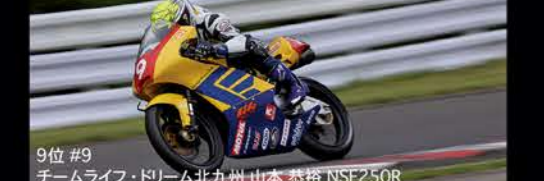
9位 #9 チームライフ・ドリム北九州山本 恭裕 NSF250R