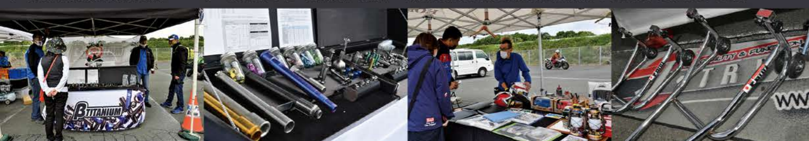
冠スポンサーであるベータチタニウムのブースではたくさんの方が技術的な説明を受けていた 千葉から遠征してきたピンストライパーの紅色屋さん スタンドの代名詞「TRIP」ブースには新作のメック仕様が！