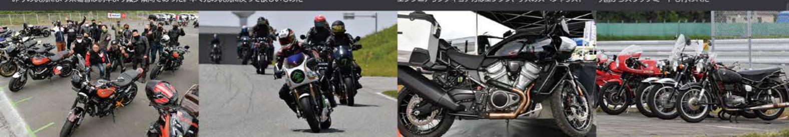
会場でZ900RSミーティングも開催され、昼休みにはサーキット体験走行も行い、オーナーはイベントを満喫していた ハーレーのアドベンチャーモデル「Pan America」を展示 来場者のマシンを見るのも楽しみのひとつ