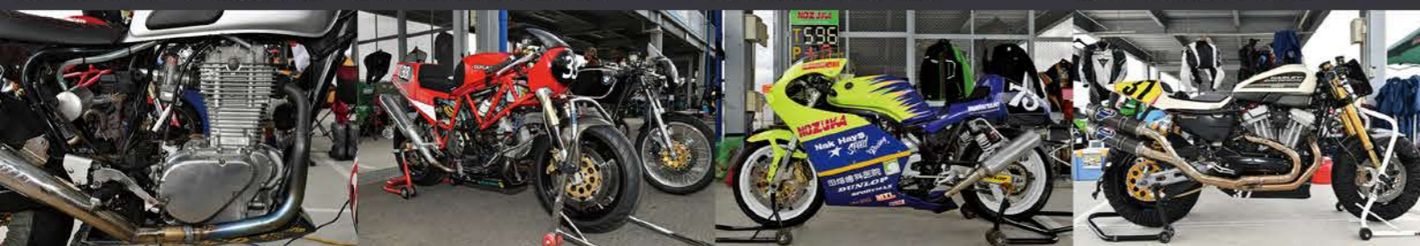
シングル・ツインクラスにエントリーしたテンプター！ ドゥカティ 900SSとBMW R75/5はRITMO ALBERO RTから ヤマハのSRX-6のツインショック！ 極太2-1-2エキゾーストを装着するのはハーレー XR1200