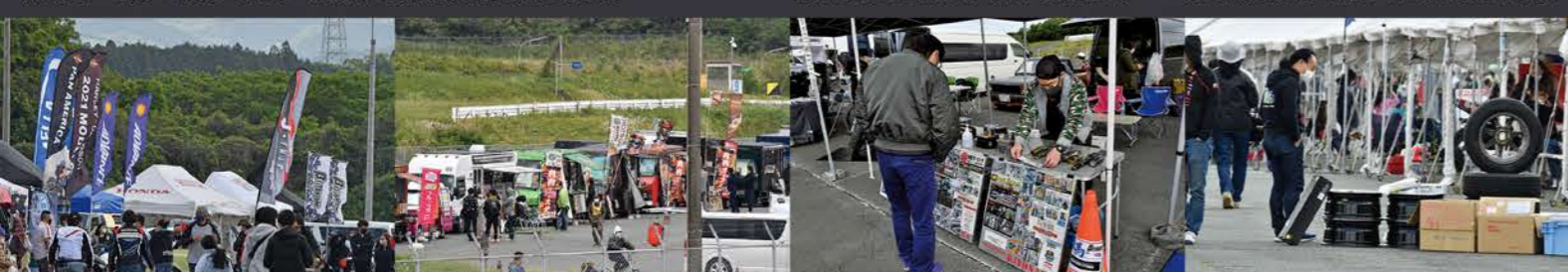
昨今の状況により来場者は例年より減少傾向であった。早く元の状況に戻って欲しいものだ エンジニアリングキヨナガはエンジン、サスのスペシャリスト 今回からスワップミートも行われた