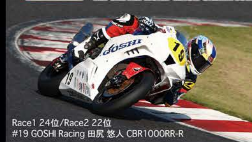
Race1 24位/Race2 22位 #19 GOSHI Racing 田尻 悠人 CBR1000RR-R