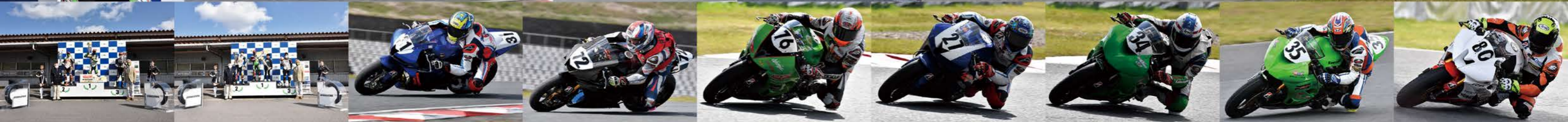
MFJ2021九州ロードレース選手権シリーズ第2戦 KYUSHU ROAD RACE CHAMPIONSHIP