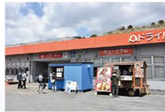
イベントによってはキッチンカーも登場する。