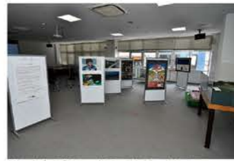
ドライバーズサロン内のレストラン向かいにミュージアムが完成した。入場は無料。