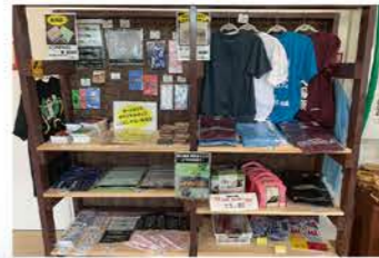
オートポリスオリジナルグッズ増殖中!