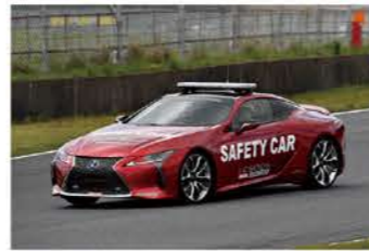
セーフティーカーのレクサスLC500h