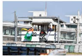
レースに欠かせないレースオフィシャルスタッフ。随時募集中なので興味のある方はウェブでチェック!