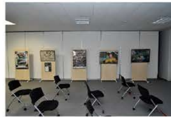
ミュージアムでは、今後動画上映なども予定されている。

いわゆる第一ヘアピンは今年からAstemoコーナーとなった。Astemoは日立オートモティブシステムズとショーワ、ケービン、日工工業が経営統合した企業。鈴鹿サーキットの日立オートモティブシステムズシケインも同様に名称変更されている。