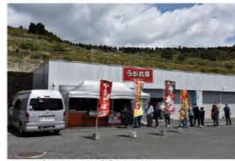
オートポリスといえば「うかれ亭」牛串や焼きそばが絶品!