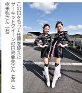
「この日をもって任期を終えたサーキットフリーの口白を披露されたこと」

フォトコンテスト入賞者の写真も展示中。オートポリスではアマチュアカメラマン大歓迎!