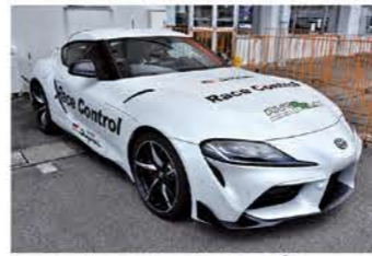
レースコントロールカーのトヨタスープラ