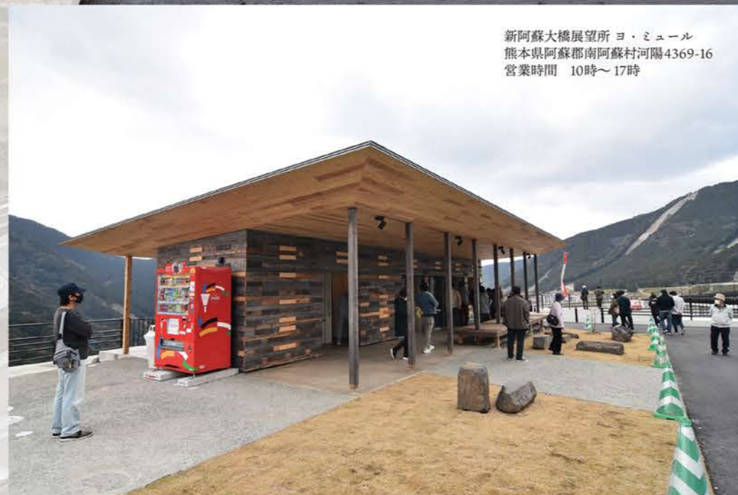
新阿蘇大橋展望所ヨ・ミユール 熊本県阿蘇郡南阿蘇村河陽4369-16 営業時間 10時~17時