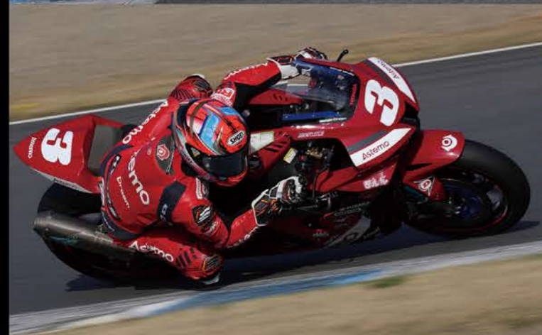
33位 #3 Astemo Honda Dream SI Racing 作本 輝介 (鹿児島) CBR1000RR-R