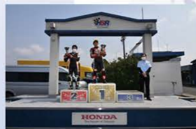
順位 # ライダー チーム マシン 1 藤崎 一寿 ワークショップ福岡RC CR8SNF4 2 有田 陽次 志摩レーシング+RSG RS

今回は賞典外ではあったが、ピュアレーサーのヤマハTZ250のシビれる全開サウンドを聞く事も出来た。 レースではST1000唯一の国際ライダー北折がウォームアップ走行中に転倒を喫しリタイア。REDレーシングSNAPIONの久原が独走優勝を飾った。S80はこのクラスの主的存在の石丸がマシントラブルでリタイアした事でワークショップ福岡RC!!藤崎が優勝を飾った。ドリームカップのS1250、S250、S400、CBR250レースではS1250クラスのNSR250を駆るモトシヨップテル・熊本東郵便局の森が総合優勝し、NSR250を駆るT2 Racing 松本がS250クラスの優勝、レーシングクラブひるしやの渡邊がS400クラス優勝、CBR250RRを駆るTeam Rappinaの菊川がクラス優勝、CBR250Rを駆るRTトップセキュリティRSの嶋津がクラス優勝を飾った。