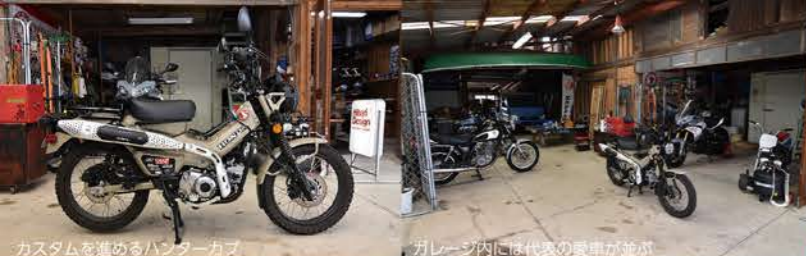
カスタムを飾めるハンターカブ

ヒバリガレージ (ひばり工房・ヒバリカフェ・ヒバリグリル) 阿蘇市一の宮町中通640-1 営業時間: 11時~17時 定休日: 火曜日