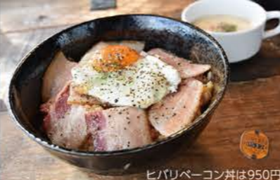
ヒバリベーコン丼は950円