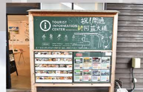
熊本地震の際にウィズバイクも協力した「南阿蘇かえる募金」で建てたボードは現在も活躍中!