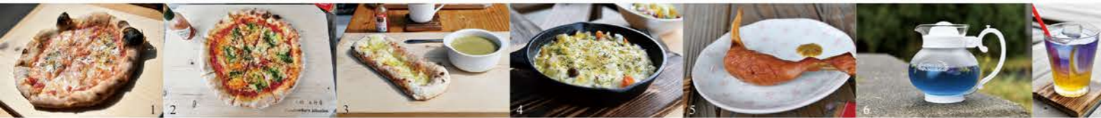
1: ピッツァは石窯で焼く本格的なもの。これはマルゲリータ。2: イタリアンパジャルソース。3: スープカレー・チーズナンセット。4: 石窯焼きカレー。5: 骨付きフランクフルト。6: 無味無臭のパタフライビーとシロップドリンク。

お父さんとバランスを取りながらのカフェ運営ですね？「似たり親子です。でもケンカもします(笑)基本的にお互いがやりたい事は干渉せずに協力し合っていて盛り上げていきたいです！」