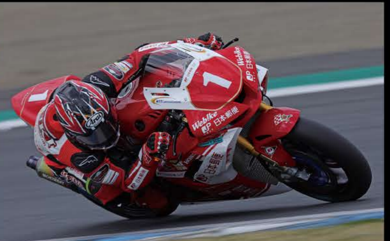
1位 #1 日本郵便Honda Dream TP 高橋 裕紀 CBR1000RR-R