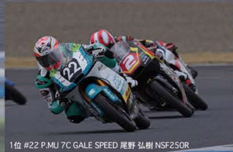
1位 #22 P.MU 7C GALE SPEED 尾野 弘樹 NSF250R