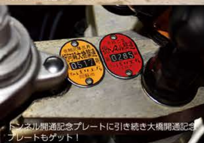
トンネル開通記念プレートに引き続き大橋開通記念プレートもゲット!