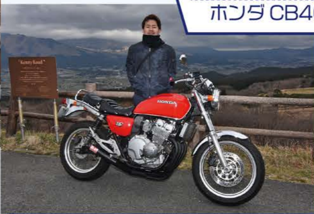
400FOURさん ホンダ CB400FOUR

熊本県北から来た400FOURさんは、ケニーロードを通り竹田を経由し産山方面にツーリング予定。「新阿蘇大橋が開通したのならまた色々なルートを考えられるのが良いですね!」