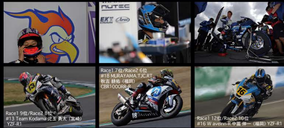
Race1 9位/Race2 8位 #13 Team Kodama 児玉 勇太（宮崎） YZF-R1