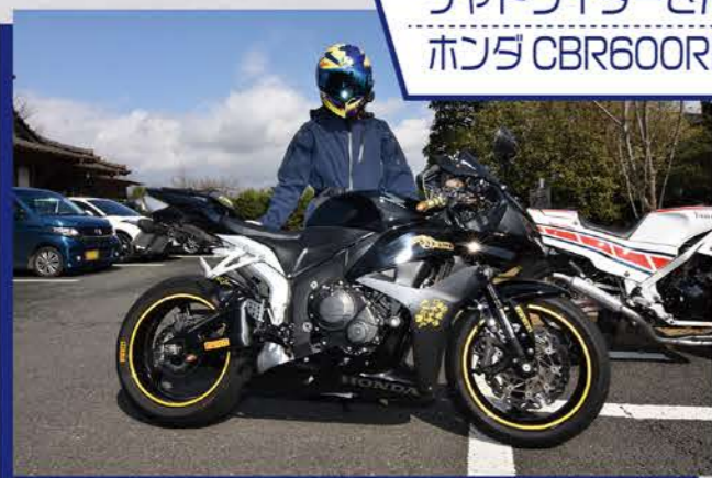
チャトライダーさん ホンダ CBR600RR

菊池方面から来たチャトライダーさんはSDR200、GSR400と乗り継ぎ今はCBR600RR。他にもDT125とカブを所有しており、ご主人もCBR1000RRRを駆るライダーだ。今日は復旧ルートを通り赤石経由の新阿蘇大橋へ。高森の黒菜コーヒーで休憩後、箱石峠を経由しヒバリガレージに立ち寄った。「震災後は地形など変わってしまいましたが、ツーリングライダーや観光客も増えてきた様で嬉しいです。」