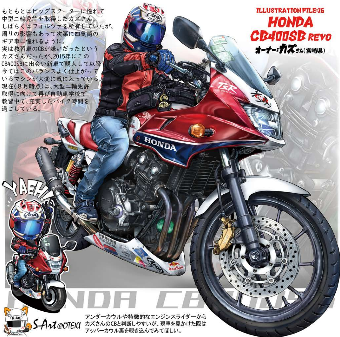
ILLUSTRATION FILE:36 HONDA CB400SB REVO オーナー:カズさん(宮崎県)

アンダーカウルや特徴的なエンジンスライダーから カズさんのCBと判断しやすいが、現車を見かけた際は アッパーカウル裏を覗き込んでほしい。