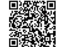
阿久根トライアルランドのfacebookページ> https://www.facebook.com/ohita.kousei/

新品から003mm摩耗してクリアランスが0.12mmにぞして写真のピストンピンコンロッド先端と接する部分に油膜切れが発生したむしがクラックヘアリングもガタが出ていました。 ちなみに写真は1000倍に拡大して見るデジタルマイクロスコープで撮ったもので、デジカメより画像は悪いのでご勘弁を。 使用オイルは安い10W40を早めの交換サイクルで使っていたんですが、空冷でも走行風による冷却が期待できないトライアル走行ではかなり過酷な状況だったと思われ。 で、問題のあった部品を新品に交換して使用オイルをどうするか出入りの業者からもらっていたオイルのカタログからハーレーなどの空冷ビッグエンジンに使用する20W60というオイルがある事が判りました。これ以上硬いオイルは無いようなので、数メーカーの中からエルフのツインテックというオイルに決定して現在使用中です。 硬いオイルなので始動時のセルモーターへの負荷が大いではないかと思いましたが、今の時期は問題なく使えています。当然バイク用なのでクラッチの滑りもなく部品交換したせいもあり、エンジンは静かです。 公道走行バイクではトライアル車両のように冷えないエンジンは無いと思いますが、夏の時期は番手を吟味すること、交換サイクルを早めることが、寿命を延ばす方法ではないかと思えます。 バイクも熱いですが人間も相当熱いので熱中症にならないように気を付けなければ。 台風10号を心配しながらエンジンオイルについて再考させられた、この夏でした。