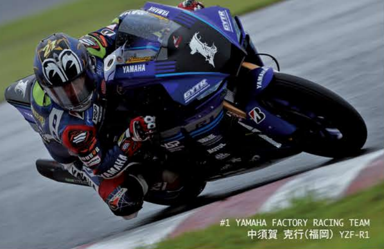
#1 YAMAHA FACTORY RACING TEAM 中須賀 克行(福岡) YZF-R1