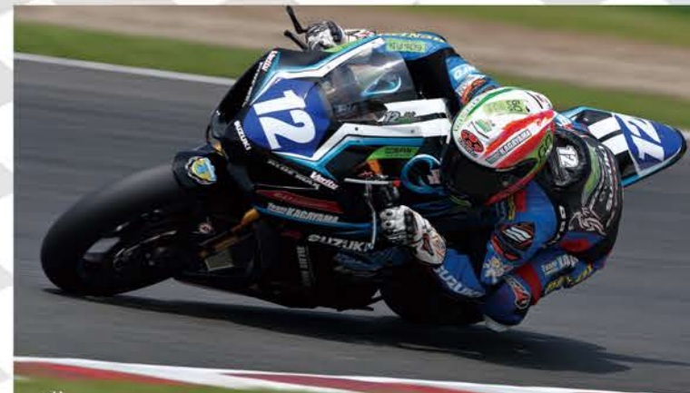
4位 #12 Team KAGAYAMA powerbyYOSHIMURA 長谷川 聖(鹿児島) GSX-R1000