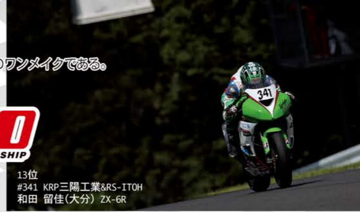
13位 #341 KRP三陽工業&RS-ITOH 和田 留佳(大分) ZX-6R