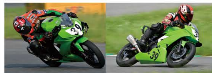
11位 #39 シングル250クラス 5位 番長+愉快的仲間達(藤田商会) Ninja250SL 野中英雄 / 藤原 啓恭 / 古賀 真一 / 藤田 巧