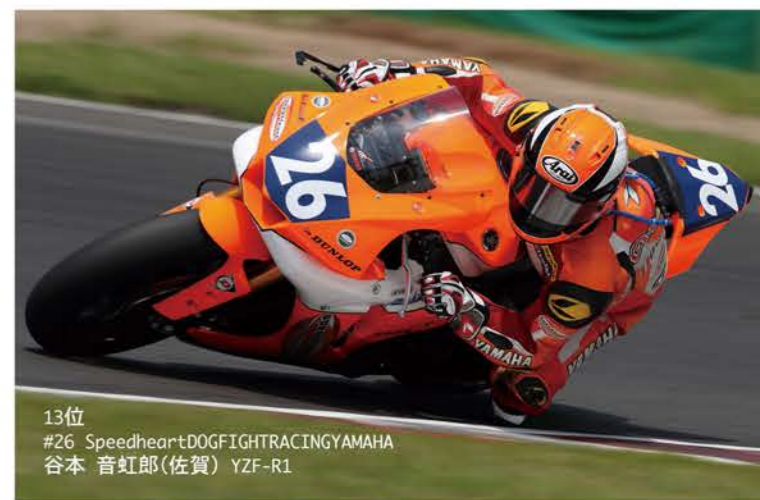
13位 #26 SpeedheartDOGFIHRACINGYAMAHA 谷本 音虹郎(佐賀) YZF-R1